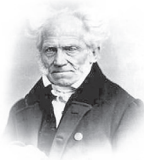
Schopenhauer-Gesellschaft e.V. - Ortsvereinigung Berlin -