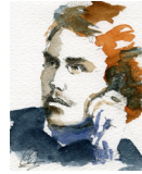
Internationale Philipp Mainländer - Gesellschaft e.V. IPM-G